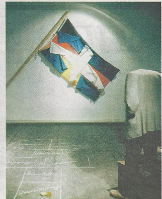
Το έργο του Βλάση Κανιάρη «Coexistence» με την καλοσιδερωμένη γερμανική σημαία και επάνω της κουρελιασμένη η ελληνική