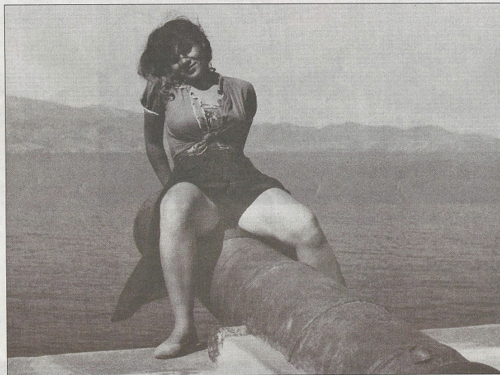
Νεαρή Υδραία φωτογραφημένη το 1956 στο νησί από τον ποιητή Ανδρέα Εμπειρίκο

Η «θραυσματική» προσέγγιση δεν είναι αναγνωρίσιμο στοιχείο μόνο στο έργο των περισσότερων καλλιτεχνών της έκθεσης, αλλά και στον τρόπο που διαχειρίζονται την έννοια της ταυτότητας. Αρκετοί από αυτούς έζησαν ή ζουν στο εξωτερικό από επιλογή ή αναγκαιότητα: Βερολίνο, Βιέννη, Λονδίνο, Σαν Φρανσίσκο, Παρίσι. Συνεπώς η γεωγραφική και ψυχολογική απόσταση από τη χώρα καταγωγής τους έχει διαμορφώσει ένα μέρος της ταυτότητάς τους. Δίπλα σε έργα ιστορικών καλλιτε-