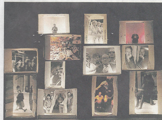
Η Ελλάδα του '80 στη φωτογραφική εγκατάσταση του Τάσου Βρεττού.

Ο τίτλος περιγράφει ένα ιεταίχμιο, στην περίπτωση μας ελληνικό, που θα μπορούσε όμως να αφορά την Πολωνία ή την Πρωτογαία.